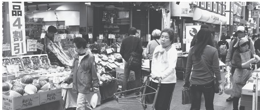
大阪市内の商店街で

公共事業に10年間で200兆円つき込み不要不急の大型事業を推進。財政危機に陥れた「自民党型バラマキ」の復活です。