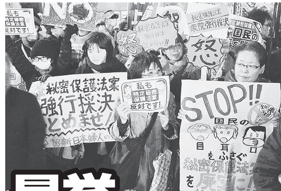
秘密保護法案の強行採決は許さないと集まった人たち 11月26日 首相官邸前