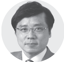
参院2期 党参院国対委員長 井上さとし 京都、東海、北陸信越

日本共産党は、今夏の参院選の比例予定候補5人を発表し、5議席めざしてがんばっています。選挙区でも勝利をめざします。