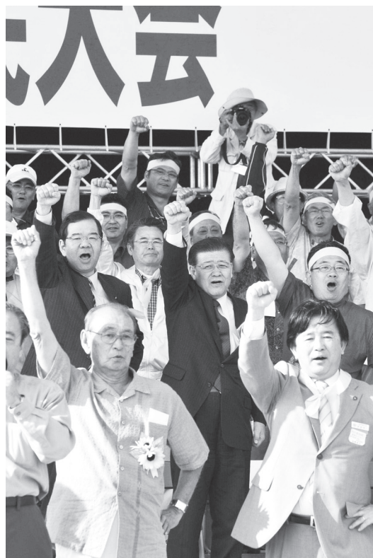
4.25沖縄県民大会でガンバローをする日本共産党・志位和夫委員長、市田忠義書記局長(中央)ら

「すぐに廃止」が公約だったのに、民主党政権は4年後に先送り。それどころか、差別医療に追い込む年齢を「65歳に引き下げる」とまでいい出しています。日本共産党は、1日も早い廃止へ力を合わせています。