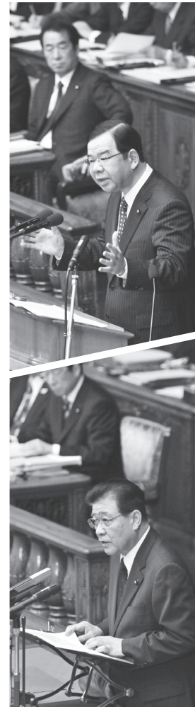
代表質問する志位委員長(1月27日)、市田書記局長(1月28日)