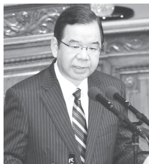
▲質問する志位和夫委員長 = 1日、衆院本会議