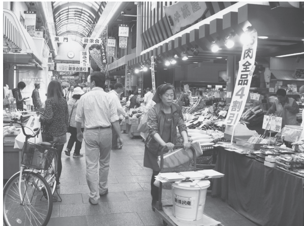
大阪市内の商店街で