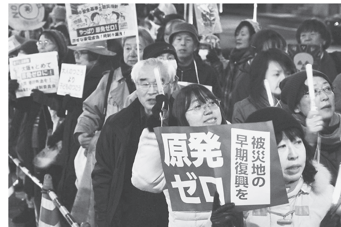
「原発ゼロを」と声を上げる人たち 2月15日、首相官邸前