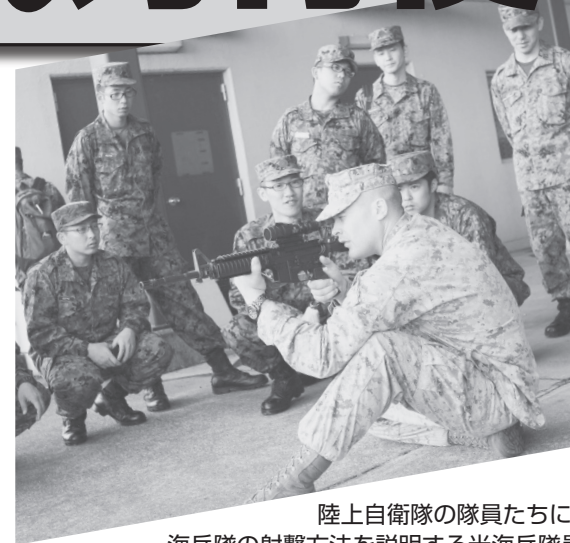
陸上自衛隊の隊員たちに、海兵隊の射撃方法を説明する米海兵隊員＝キャンプ富士