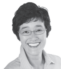
倉林 明子 (京都)