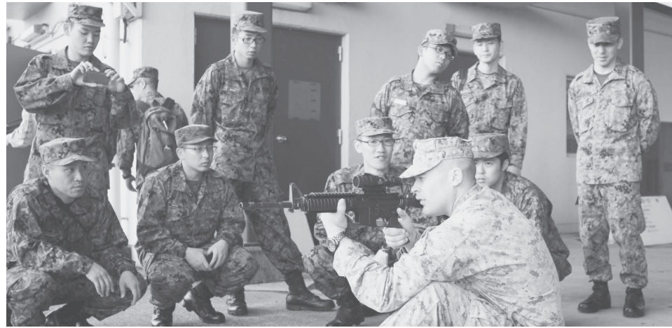
陸上自衛隊の隊員たちに、海兵隊の射撃方法を説明する米海兵隊員。6月19日、キャンプ富士

安倍首相は、集団的自衛権についての歴代政府の説明をひっくり返すため、「憲法の番人」といわれる内閣法制局長官を自分と同じ考えの人物に