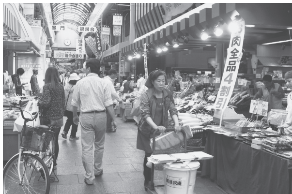
大阪市内の商店街で