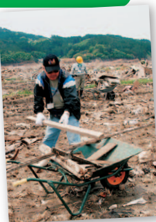
救援・復興ボランティアに 全国から3万人

党員数……………31万8,000人 党支部……………約2万 機関紙読者………130万人 地方議員数………2,737人