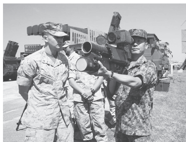
米海兵隊員の前で対空ミサイルを構えてみせる陸上自衛隊の隊員

日本はいずれにも自衛隊を派兵しましたが、派兵法第2条の「武力行使をしてはならない」「戦闘地域に行つてはならない」という「歯止め」がかかっていました。