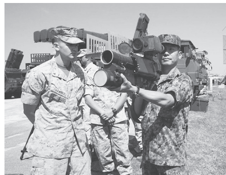
米海兵隊員の前で対空ミサイルを構えてみせる陸上自衛隊の隊員