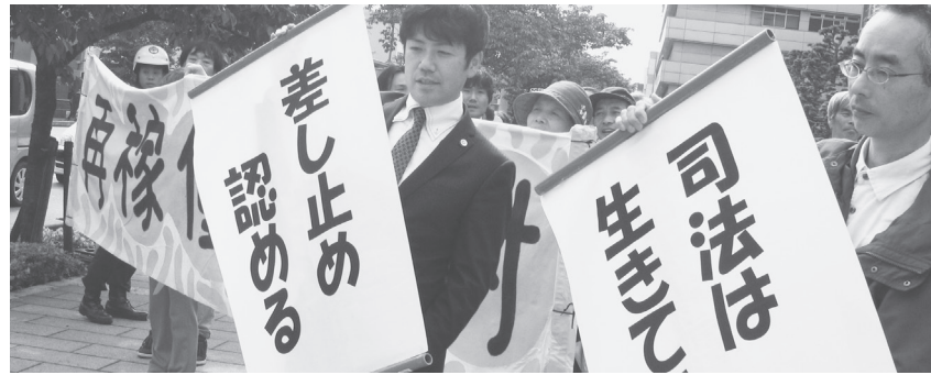
関西電力大飯原発の運転差し止めを命じる判決を受け、垂れ幕を掲げる弁護団ら 5月21日午後、福井市