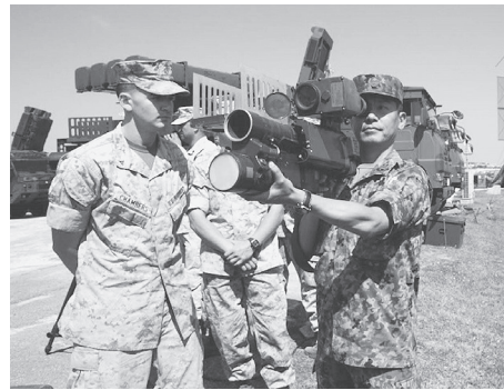
米海兵隊員の前で対空ミサイルを構えてみせる陸上自衛隊の隊員