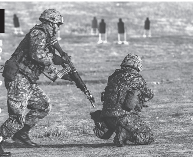
米海兵隊との共同演習で射撃訓練をする陸上自衛隊員

安倍政権が、集団的自衛権行使を可能にする憲法解釈変更の閣議決定を強行しようとしています。閣議決定案は、日本への武力攻撃がなく