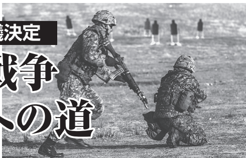
米海兵隊との共同演習で射撃訓練をする陸上自衛隊員