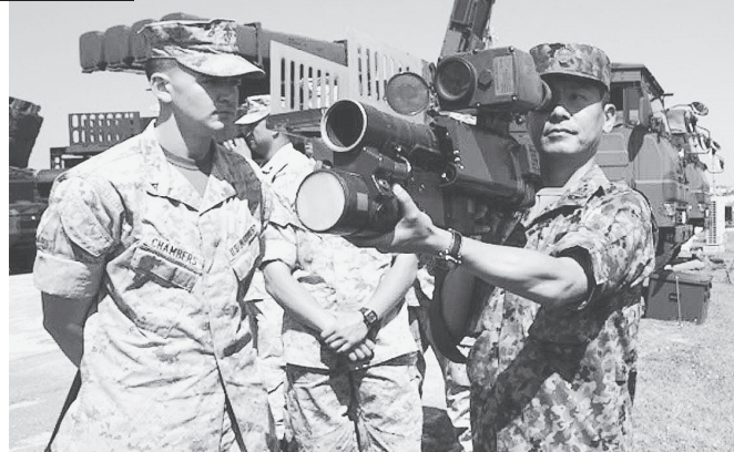
米軍普天間基地で新しい防空装備を米海兵隊に披露する自衛隊員(4月中旬)

「イラク侵略のような米国の戦争で、自衛隊が戦地に派兵される」—集団的自衛権の行使容認で、日本のあり方は180度変わってしまいます。