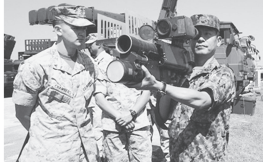
米軍普天間基地で新しい防空装備を米海兵隊に披露する自衛隊員(4月中旬)

「イラク侵略のような米国の戦争で、自衛隊が戦地に派兵される」—集団的自衛権の行使容認で、日本のあり方は180度変わってしまいます。