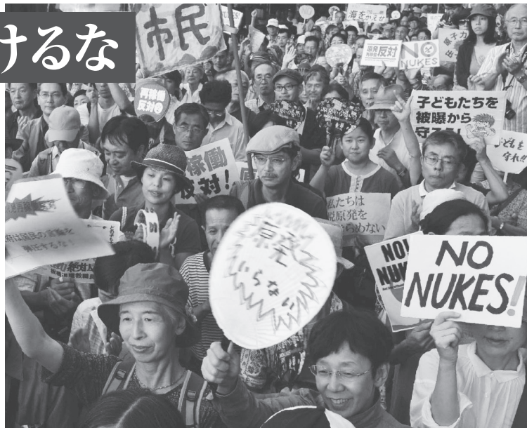
川内原発の再稼働やめよ、原発なくせと集まった人たち 11月8日、国会前

■政府は「世界で最も厳しい規制基準」と言いますが、真っ赤なウソです。欧州連合（EU）で採用されている格納容器の二重化も求めています。 ■深刻なのは火山噴火の影響。「大噴火の予知は困難」（専門家）なのに、その対策も住民の避難計画にもまともに対応していません。