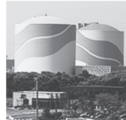
九州電力・川内電力

今年の夏は商業用原発が電力供給を開始して以来、はじめて「稼働原発ゼロ」の夏になりましたが、電力不足はどこにも起きませんでした。しかし安倍政権は、原発を永久に使い続ける「エネルギー基本計画」を決め、九州電力・川内（せんだい）原発を突破口に再稼働へ暴走しています。