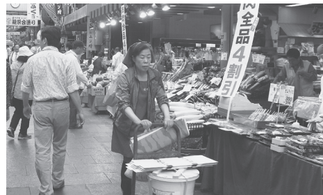
大阪市内の商店街