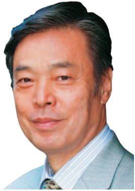
こくた 恵二 ・前 党国会対策委員長 京都1区候補