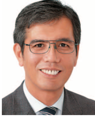
宮本 たけし ・前 衆院議員2期