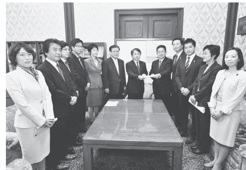
ブラック企業規制法案を提出する日本共産党参院議員団（2013年10月）