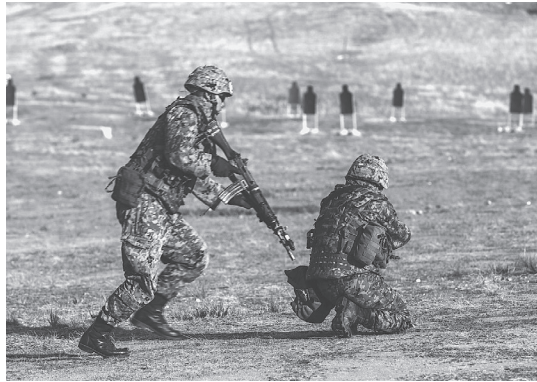
米海兵隊との共同演習で射撃訓練をする陸上自衛隊員

政府は、自衛隊がアメリカの戦争を支援する「2つの枠組み」を示しています。自衛隊派兵の「恒久法」と「周辺事態法」の改定です。2つに共通しているのは、従来の「戦闘地域に行ってはならない」という歯止めが外されることです。