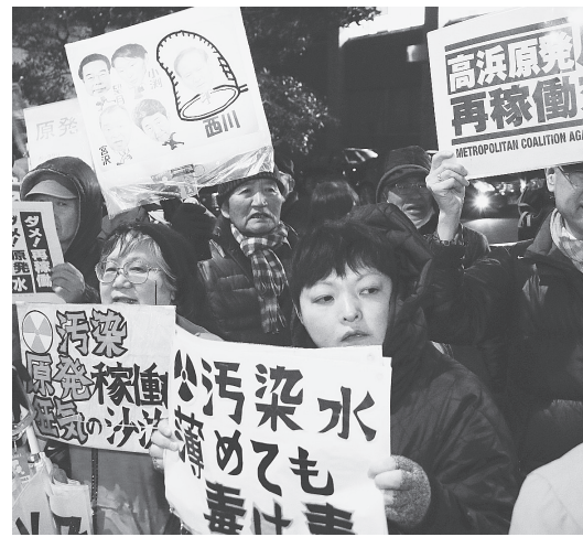
首都圏反原発連合が行っている首相官邸前 行動 2月27日