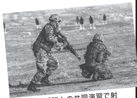
米海兵隊との共同演習で射撃訓練をする陸上自衛隊員