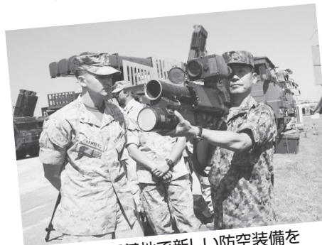
米軍普天間基地で新しい防空装備を米海兵隊に披露する自衛隊員

米国がアフガン・イラク戦争のような戦争を始めたら、自衛隊がこれまで禁じられてきた「戦闘地域」にまで行って軍事支援することになります。そうすれば、相手から攻撃され、戦闘になる——「殺し殺される」危険を飛躍的に高めます。「後方支援」と言っても、世界では弾薬などを補給する兵たん。武力行使と一体の活動です。敵に狙われるのは世界の軍事常識です。