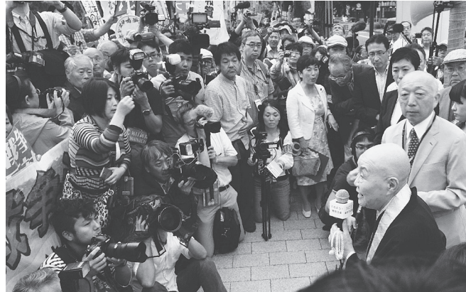
訴える瀬戸内寂聴さん(右) = 6月18日

93歳の作家・瀬戸内寂聴さんは、国会前集会に参加し、「戦争を二度と繰り返してはなりません」と訴えました。