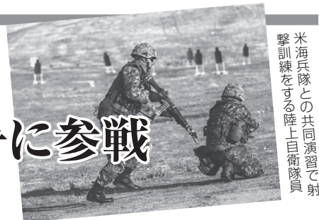
米海兵隊との共同演習で射撃訓練をする陸上自衛隊員

日本政府は、米国の無法な侵略戦争だったベトナム戦争、イラク戦争を支持しましたが、今なお誤りを認めず検証もしていません。こんな国は主要国でも日本だけ。異常なまでの対米追随の政府が集团的自衛権の行使に踏み出すのは余りにも危険です。