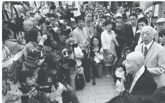
訴える瀬戸内寂聴さん(右) = 6月18日

93歳の作家・瀬戸内寂聴さんは、国会前集会に参加し、「戦争を二度と繰り返してはなりません」と訴えました。