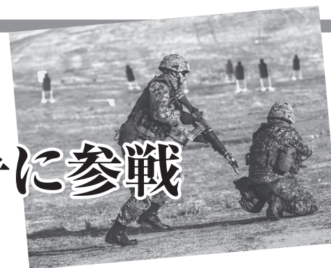
米海兵隊との共同演習で射撃訓練をする陸上自衛隊員

日本政府は、米国の無法な侵略戦争だったベトナム戦争、イラク戦争を支持しましたが、今なお誤りを認めず検証もしていません。こんな国は主要国でも日本だけ。異常なまでの対米追随の政府が集团的自衛権の行使に踏み出すのは余りにも危険です。