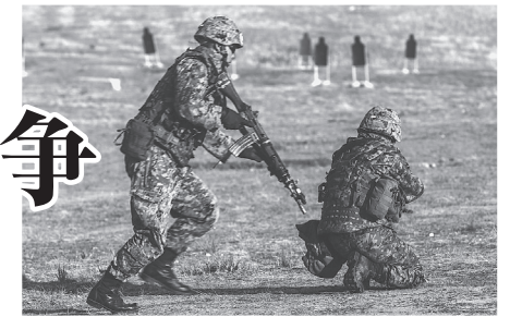
米海兵隊との共同演習で射撃訓練をする陸上自衛隊員

日本への武力攻撃がなくても、集団的自衛権を発動し、自衛隊が海外での武力行使に乗り出すこととなります。