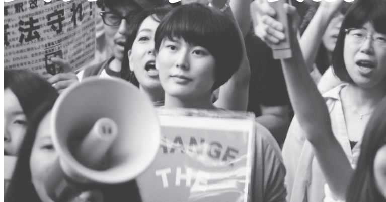
戦争法案廃案へ2万人が参加した大阪御堂筋のデモで11月13日