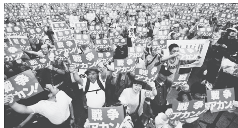
「戦争法案を必ず廃案に」と声を上げる人びと(15年8月30日、大阪・扇町公園)