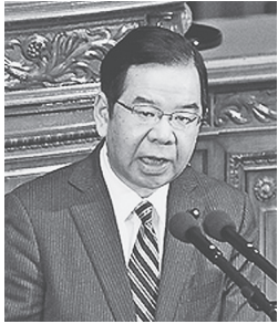
▲ 質問する志位委員長 11月27日、衆院本会議