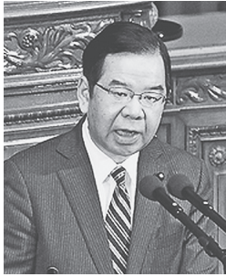
▲ 質問する志位委員長 11月27日、衆院本会議