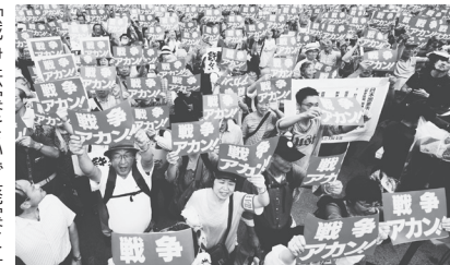
「戦争法案を必ず廃案に」と声を上げる人びと（15年8月30日、大阪・扇町公園）