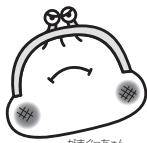
がまくちやんのカクサン部!

庶民増税の一方、大企業には巨額の減税バラマキです。安倍政権がこれまで行った企業減税は13兆円、来年度以降さらに1兆円上乗せ。しかしその結果は、賃金にも設備投資にも回らず、内部留保が積みあがっただけ(この3年間で38兆円増、300兆円を突破)。逆立ちした税制は根本から改めるべきです。