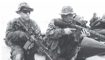
▶ グラムでの日米合同強襲上陸作戦

戦争法は、日本に重大な危険を つくりだしています。自衛隊の武器使用が大幅に緩和され、南スーダンPKO(国連平和維持活動)に派遣されている自衛隊が外国人を殺し、戦死者を出す危険です。米国などが過激組織・ISに対する空爆への支援を要請してきたら、戦争法がある今となつては断れません。