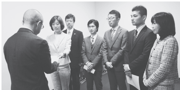
関電に申し入れる日本共産党の参院予定候補 7日、大阪市北区

高浜4号機の緊急停止は、トラブル公表5段階の基準で最も高いレベル4の重大事態。また冷却水漏れは重大事故につながりかねません。ところが関電は漏れの原因とされるバルブを締め直しただけで、予定通り26日に再稼働というスケジュールを強行しました。もうけ第一で強行 いま電力不足は起きていません。火力発電所の燃料費を節