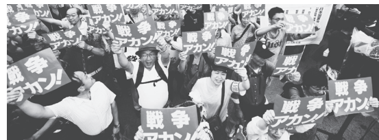
「戦争法案を必ず廃案に」と声を上げる人びと（15年8月30日、大阪・扇町公園）

中国や北朝鮮が軍事力を高めれば、日本も対抗して「抑止力」を高める――。これでは「軍事対軍事」の悪循環に陥ります。暮らしが困難に直面しているとき、軍事優先の国づくりが、日本の歩むべき道でしょうか。