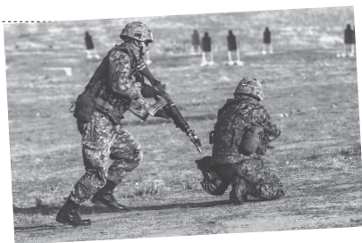
米海兵隊との共同演習で射撃訓練をする陸上自衛隊員

戦争法では、米軍などへの兵站支援を大幅に拡大。支援内容も戦闘発進中の米軍機への給油などに広がっています。戦争法の一つ「海外派兵恒久法」では、日本政府の「政策判断」次第で空爆支援もありえることになっています。