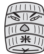
僕米太郎

日本農業をこわし、多国籍企業に経済主権を売り渡す TPP。「聖域まもる」「情報公開」という国会決議をふみにじって強行するなど許せません。