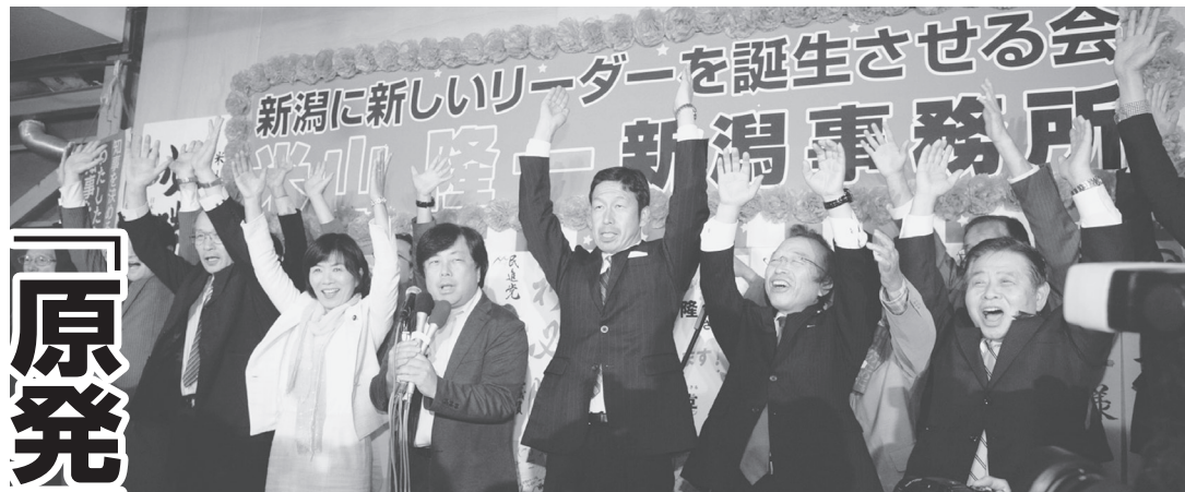
当選を喜ぶ米山隆一知事候補（中央）と支持者。16日、新潟市の米山選挙事務所