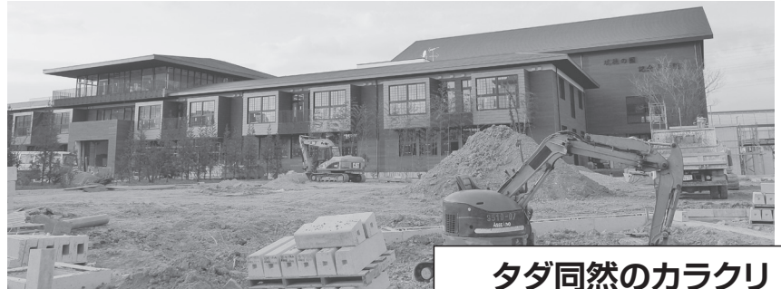
建設がすすむ瑞穂の國記念小學院＝大阪府豊中市