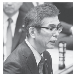
質問する宮本氏 =2月24日、衆院予算委

日本共産党の宮本岳志衆院議員（近畿ブロック選出）は、2月24日の衆院予算委員会で学園側の建設業者と近畿財務局、大阪航空局の担当者が会い、土壌改良工事を巡って突