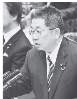
質問する小池晃書記局長 11日、参院予算委

大阪府豊中市の国有地が、学校法人「森友学園」（籠池泰典理事長）に小学校用地として格安で売却された疑惑。鑑定価格約10億円の土地が8億円以上も値引きされ、その上、売却代金1億3400万円を10年間の分割払い。こんな破格なことは政治家の関与なしには起こりえません。