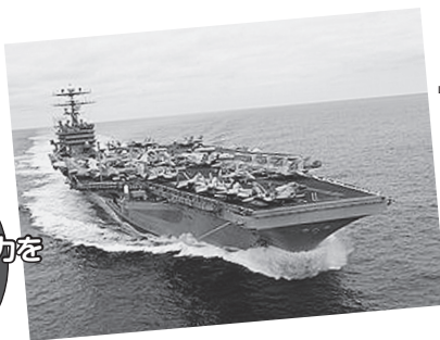
朝鮮半島近海に向け北上している とされる米原子力空母「カール・ ビンソン」