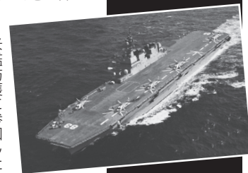
米艦防護に参加した海上自衛艦「いずも」

安倍首相が憲法9条1項・2項を残しつつ自衛隊を書き込む、オリンピック・パラリンピックの2020年に施行すると言いつつ出しました。自衛隊を憲法で追認するだけにとど