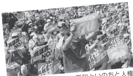
「いいね！日本国憲法—平和といのちと人権を！5・3憲法集会」に5万5千人が声援＝5月3日、東京都江東区